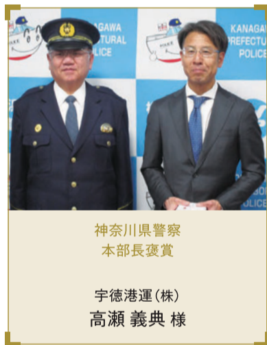
神奈川県警察 本部長褒賞

※令和7年9月24日までの受賞者を掲載しております。10月28日に実施されました横浜市防犯協会連合会防犯功労者表彰式につきましては来年度の広報にてご報告いたします。