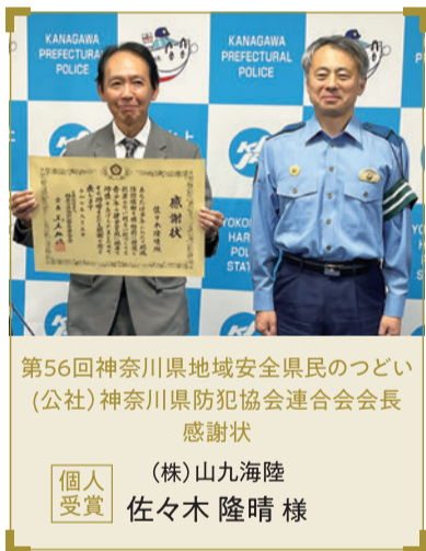
第56回神奈川県地域安全県民のつどい (公社)神奈川県防犯協会連合会会長 感謝状