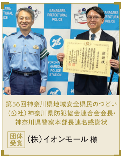
第56回神奈川県地域安全県民のつどい (公社)神奈川県防犯協会連合会会長・ 神奈川県警察本部長連名感謝状