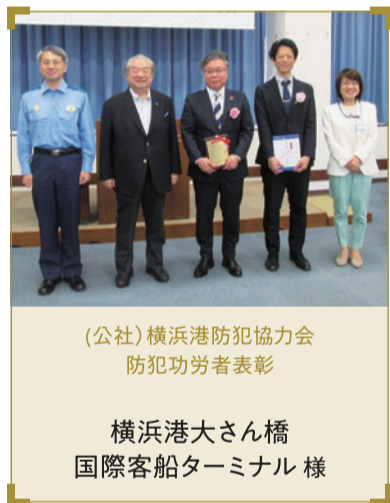
(公社)横浜港防犯協会 防犯功労者表彰