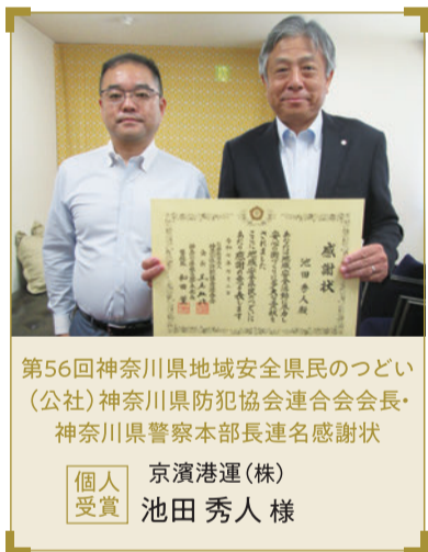
第56回神奈川県地域安全県民のつどい (公社)神奈川県防犯協会連合会会長・ 神奈川県警察本部長連名感謝状